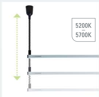
Zugpendelleuchte UNILED SL AC

LED Leuchte mit höhenverstellbarer Zugpendel, Deckenbefestigung, 230V AC Anschluss über Deckenklemme, Material Aluminium, Kunststoff, Abdeckung Opalweiß oder Mikroprismen