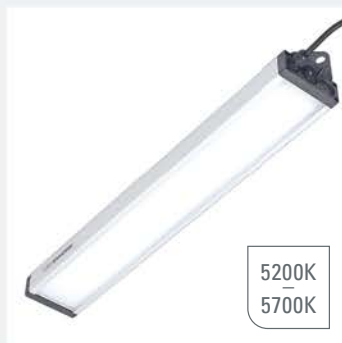
Unterbauleuchte UNILED SL AC

LED Leuchte mit höhenverstellbarer Zugpendel, Deckenbefestigung, 230V AC Anschluss über Deckenklemme, Material Aluminium, Kunststoff, Abdeckung Opalweiß oder Mikroprismen