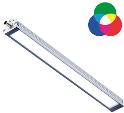
Darstellbares Farbspektrum / Displayable colour spectrum