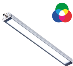
Darstellbares Farbspektrum / Displayable colour spectrum