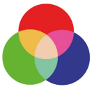
Mischfarben werden mit der Ansteuerung mehrerer Eingänge gleichzeitig erreicht. / Mixed colours will be achieved with the control of multiple inputs simultaneously.